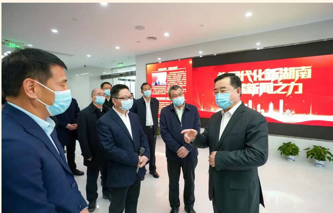
2月28日下午，湖南省委书记、省人大常委会主任张庆伟调研湖南广电。