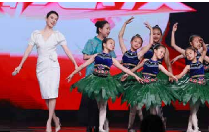
《彩云计划》讲述身处山村的芭蕾舞女孩们对梦想的期待与感悟。