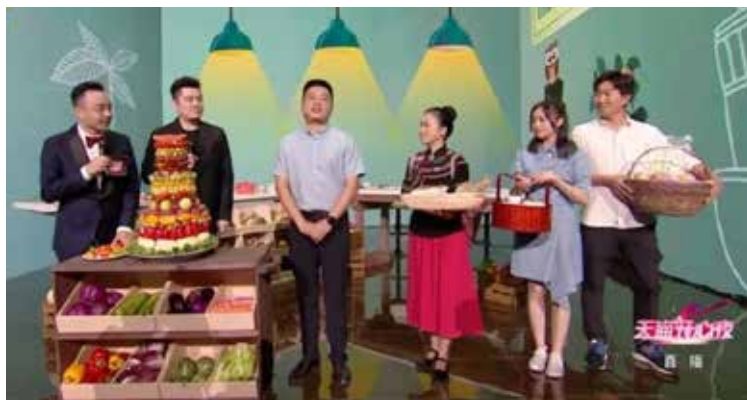
新农人们在节目现场展示乡村振兴、科技与农业共生的硕果。

高速发展中，时代处处有新景，生活处处有新意。“打开生活新惊喜”是对美好生活的体验，是坚持逐梦的快乐，更是祖国繁荣富强带来的幸福感。