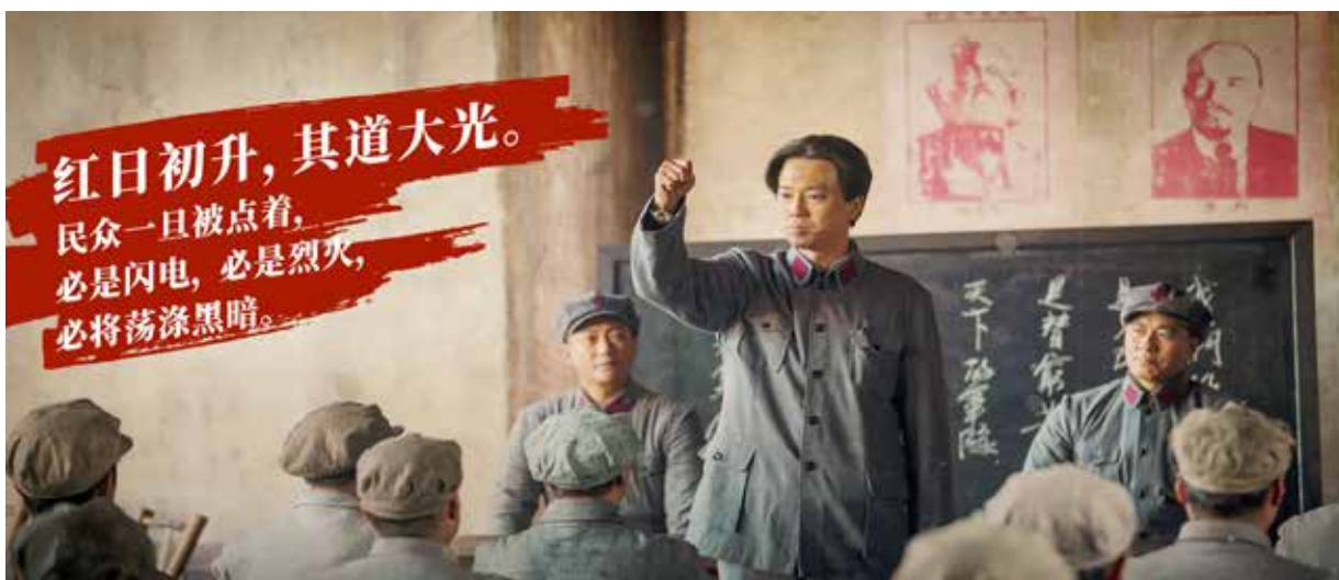
电视剧《百炼成钢》：以歌咏史再现建党百年辉煌。