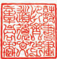
詩書畫印齊步道 德文章同香