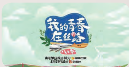
《我的青春在丝路》宣传海报