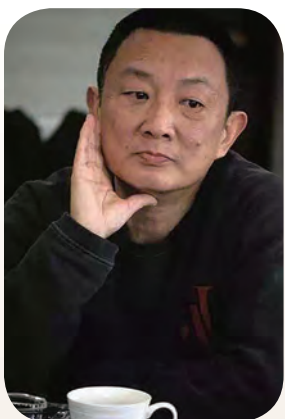
导演张黎 人强不如货强， 匠心坚守专业和使命

虽然当时只有三台笨重的台式摄像机，布景、道具和灯光也十分简陋，但也正是在这艰苦的环境中，中国电视人跟随着新中国铿锵的前进步伐、乘着改革开放的和煦春风，通过数代怀揣振兴中国电视剧梦想的从业者的不懈努力，如今取得了令国人骄傲、令世人瞩目的成绩。