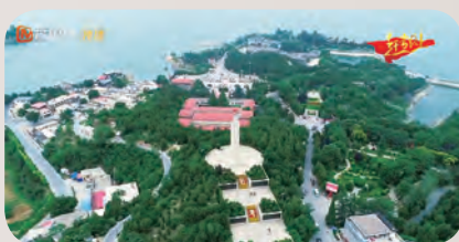
聚焦七名共产党人“为人民的美好生活而奋斗”的《赶考路上》