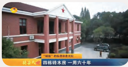
2013年《县委大院》开辟了芒果台新闻大片先河