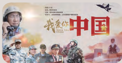
《我爱你，中国》第一、二季掀起荧屏中国红

国梦的感人故事，这些奋斗于无声处的实干家、追梦人第一次从“幕后”走到台前，成为民族精神的播种者、擎灯人。