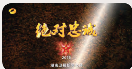
《绝对忠诚》获2015年中国新闻奖一等奖