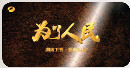
《为了人民》获2018年中国新闻奖一等奖