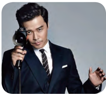
导演陈思诚 时代变迁中保持坚守， 遵循内心认真创作

当年轻气盛的张黎怀揣着艺术梦想跨入北京电影学院的时候，导演陈思诚出生在辽宁沈阳的一个干部家庭。成长在改革开放初期的陈思诚，其少年时代与张黎这代人比起来已有了巨大变化。