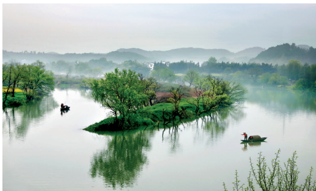
人在画中游 一等奖