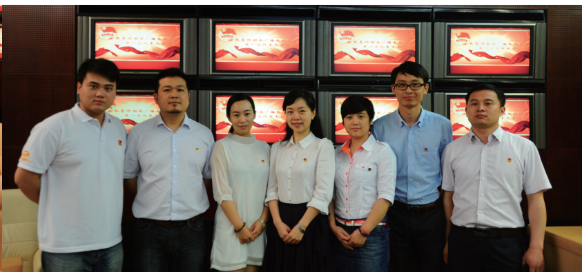
共青团湖南广播电视台第一届委员会