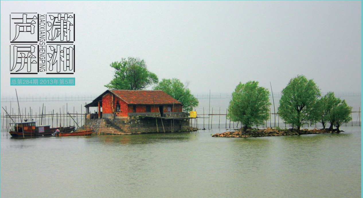
湖中小屋