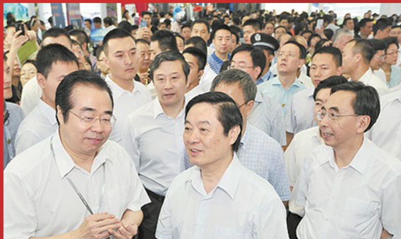
中共中央政治局委员、中央书记处书记、中宣部部长刘奇葆考察湖南主展馆

此次湖南展团活动由省委宣传部主办、湖南日报报业集团承办，参展主题为“文化湖南”，湖南日报报业集团、湖南广播电视台、中南出版传媒集团股份有限公司等集体亮相，推出了湖南文化产业推介暨“资本点亮文化梦想”主题活动、大湘西文化旅游融合发展推介会、《中国文化品牌发展报告(2013)》首发式暨中国文化品牌排行榜发布会等三大主题活动。