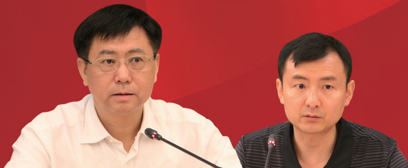
湖南广播电视台党委书记、台长吕焕斌